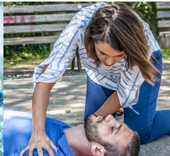
Pérdida de conciencia